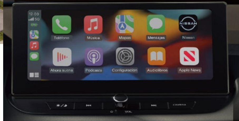
Pantalla digital 12.3"