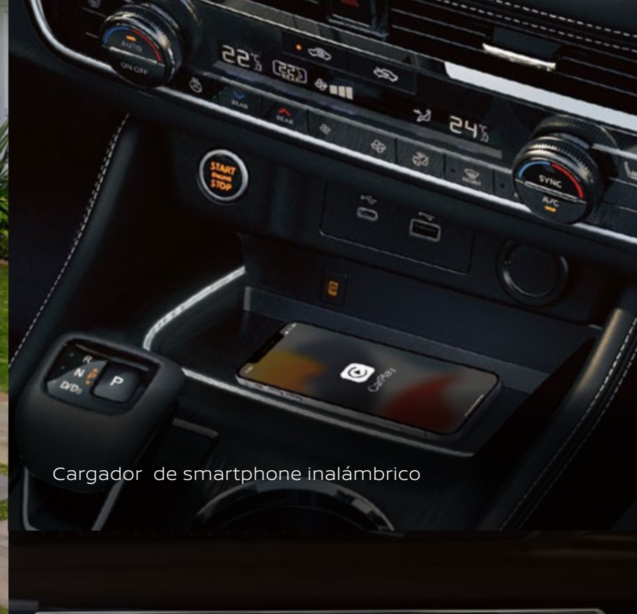
Cargador de smartphone inalámbrico

Imágenes de referencia. Los accesorios mostrados pueden venderse por separado. Consulta la ficha técnica para conocer el detalle de especificaciones. Consulta nivel de equipamiento y disponibilidad por versión y zona geográfica con tu Distribuidor Autorizado Nissan o visítanos en Nissan.com.mx