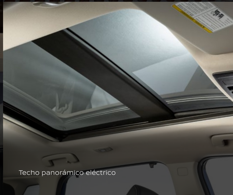
Techo panorámico eléctrico