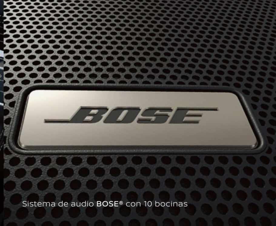
Sistema de audio BOSE® con 10 bocinas